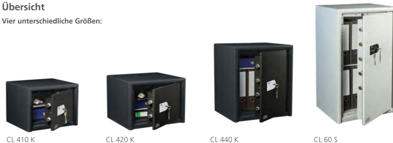
CL 410 K