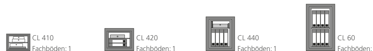
CL 410 Fachböden: 1