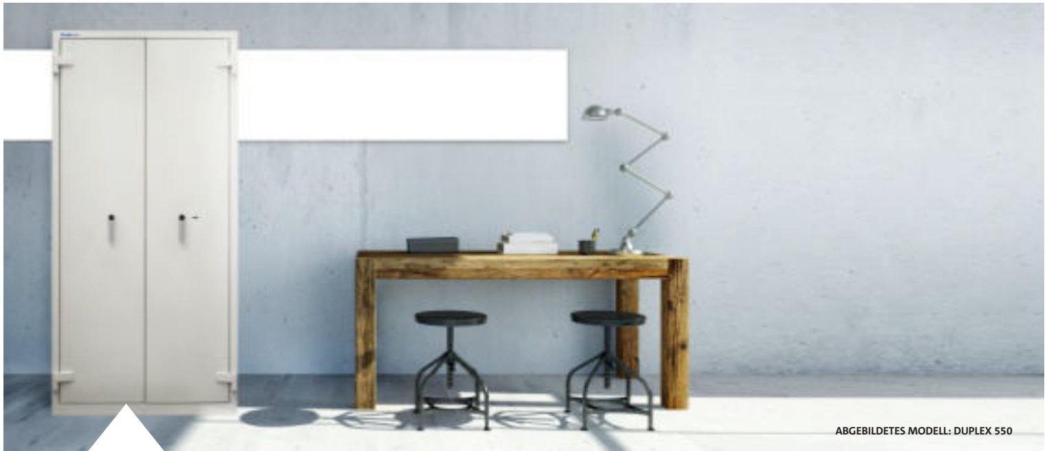
ABGEBILDETES MODELL: DUPLEX 550