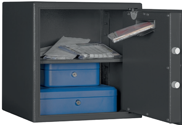
F 2 mit Einwurfschlitz Graphitgrau • Graphite grey Dekoration nicht im Lieferumfang enthalten • decoration not included in the delivery

Keine empfohlenen Versicherungssummen verfügbar - bitte informieren Sie sich bei Ihrem Versicherer