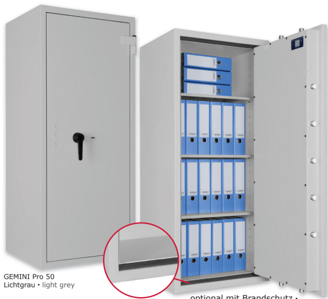
GEMINI Pro 50 Lichtgrau • light grey

optional mit Brandschutz • optional with fire protection