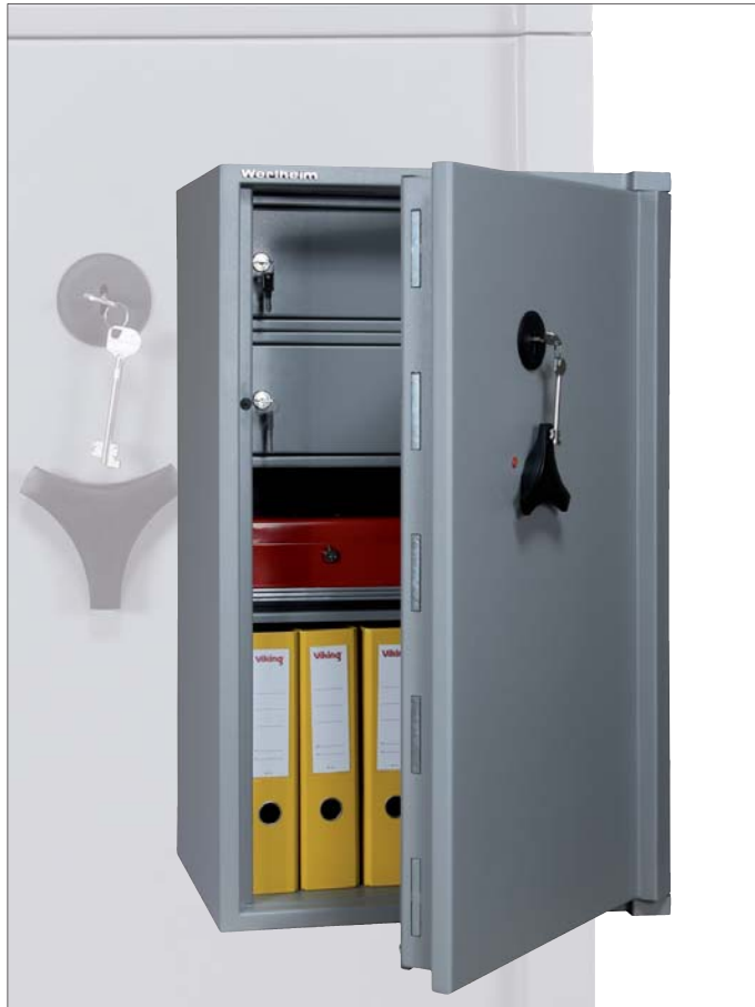
Abb. Wertschutzschrank AM25, Türbandung rechts K-Schloss Cawi 2 Schlüssel (95 mm), 2 Innentresore, 1 Fachboden